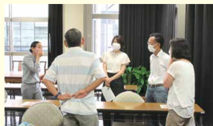
春夏・英語を楽しもう(金曜日)