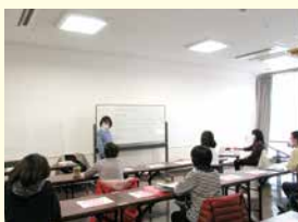
春夏・日本人講師による超入門の英会話