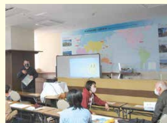
春夏・英語を楽しもう(火曜日)