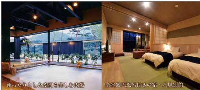
ゆったりとした空間を楽しむ内湯