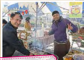
国際ふれあいフェスタ in OTSU