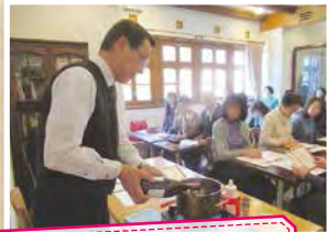
ドイツのクリスマスを楽しもう!