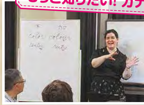
もっと知りたい! カナダ