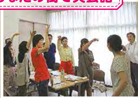
あなたの街で英会話