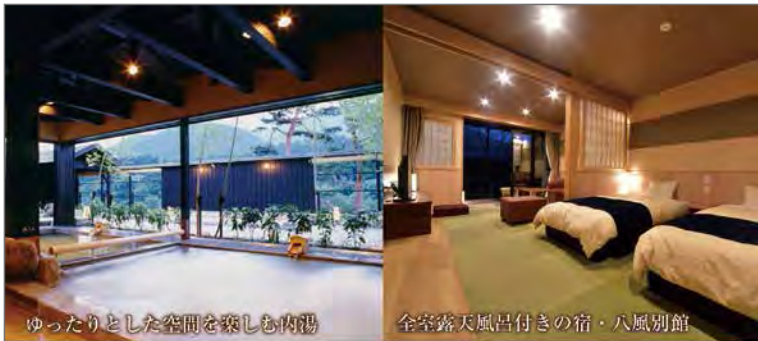
ゆったりとした空間を楽しむ内湯