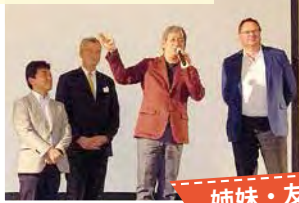
姉妹・友好都市交流