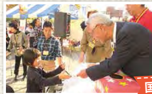
国際ふれあいフェスタ in OTSU