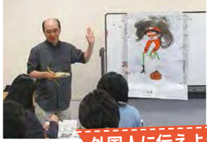
外国人に伝えよう!日本と大津の魅力