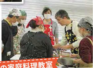
イタリアの家庭料理教室