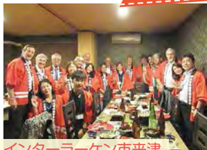
インターラーケン市来津