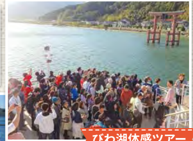
びわ湖体感ツアー